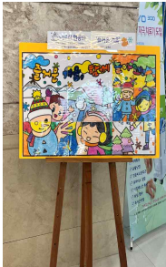
<어르신 협동화 전시>